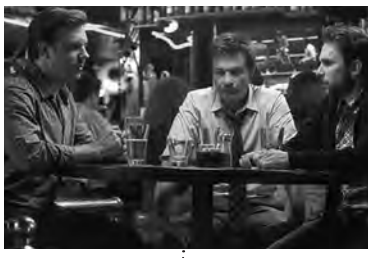
23:15 ТЕЛМА Ужасни шефови филм