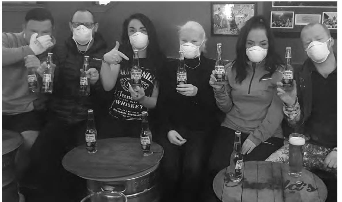
↑ Во светот веќе се вратат вакви слики, ќе ги има ли наскоро и кај нас?

Според Виктор Мизо, претседател на Асоцијацијата на странски компании со технолошки напредно производство, кои создаваат 60 отсто од нашиот извоз, веќе нема проблем со набавка на репроматеријали и