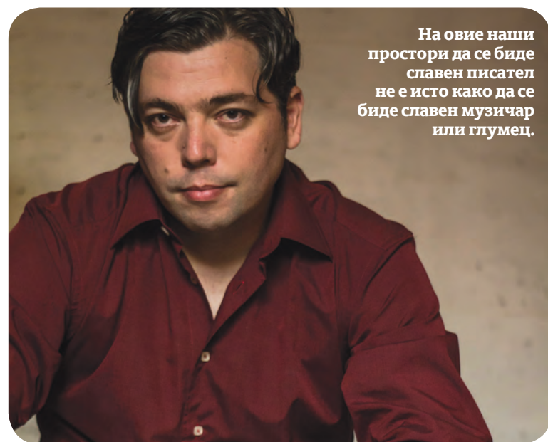
На овие наши простори да се биде славен писател не е исто како да се биде славен музичар или глумец.

Би сакал да дознаам две работи: кој и зошто ја растури Југославија и кој беше наречател на убиството на премиерот Зоран Џинџиќ?