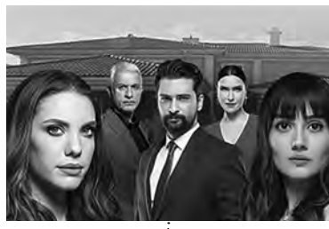
21:30 КАНАЛ 5 Забрането јаблоко играна серија