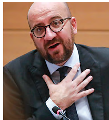
↑ Шарл Мишел

На прашање за строгите мерки за полициски час и карантин во