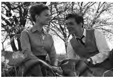
21:05 24 ВЕСТИ Женски рај играна серија