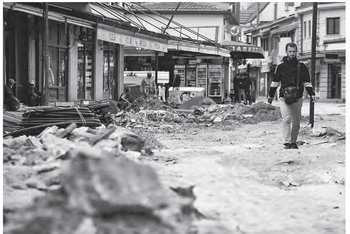
↑ Фотографија Слободен печат / Арбнора Мемети

Ако се прашувате каква врска има зајакот од почетокот на приказната со чаршијата. Нема никаква, како што ни нашиве заштитари во последно време немаат врска со заштитата.